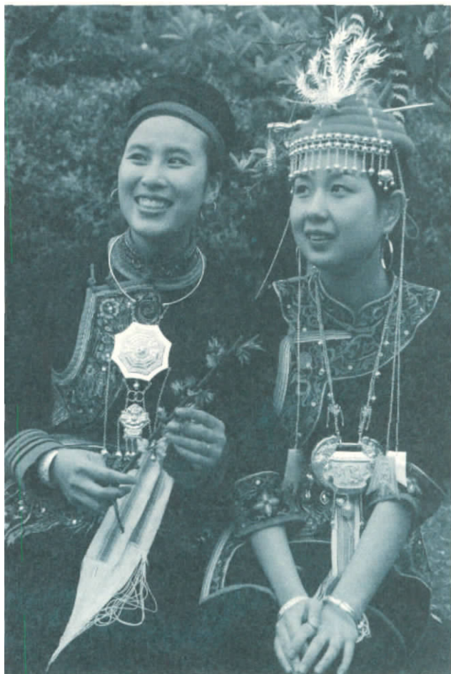
佩戴“珍华堂”银饰的畲族姑娘

近年来,闽东各级政府在抢救、保护与发展畲族文化的工作中,采取了一系列行之有效的举措,濒临失传的畲族民间传统工艺也被纳入抢救和保护的范围。人们意识到,闽东畲族民间工艺是畲族群众长期生产、生活实践的结晶,是我省少数民族珍贵的文化遗产,对于当今振兴民族经济、繁荣民族文化,提高少数民族群众生活水平,仍然具有十分重要的作用。因此,各级政府及行业主管部门将“珍华堂”作为富有特色的民族民间工艺企业,采取一系列保护、扶持和发展的措施,并不断加强引导和服务。