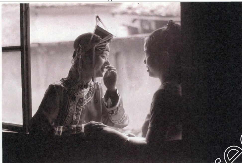
▲凤凰传奇的故事在倚窗攀谈的侗族妇女口中娓娓道来。

雕工艺刻有毛泽东及56个民族团结图案，“五星红旗”和“华表”分设鼎身两侧，底部还以祥云底纹加以衬托。2012年5月，在第七届海峡工艺博览会上，《大团结》获得中国工艺美术“百花奖”特别金奖。