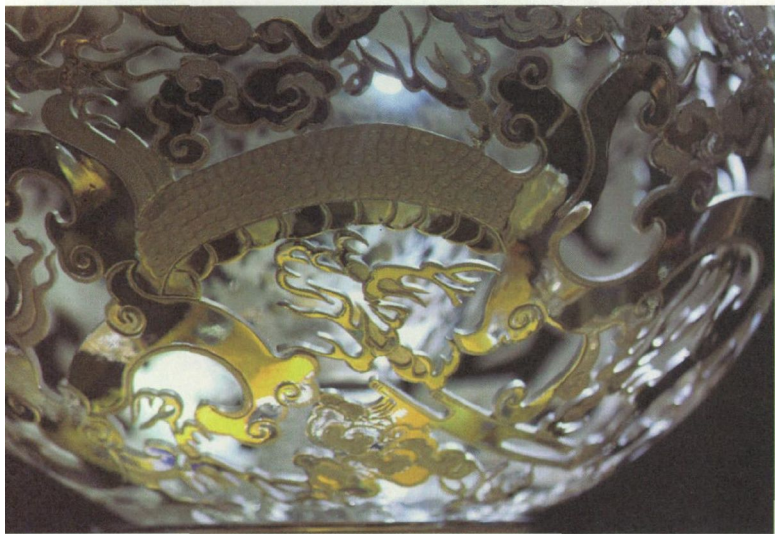
▲经过技艺创新的畲银有了别样光辉。