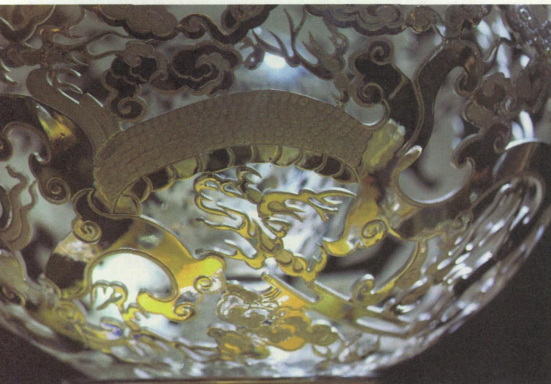
▲经过技艺创新的畬银有了别样光辉。