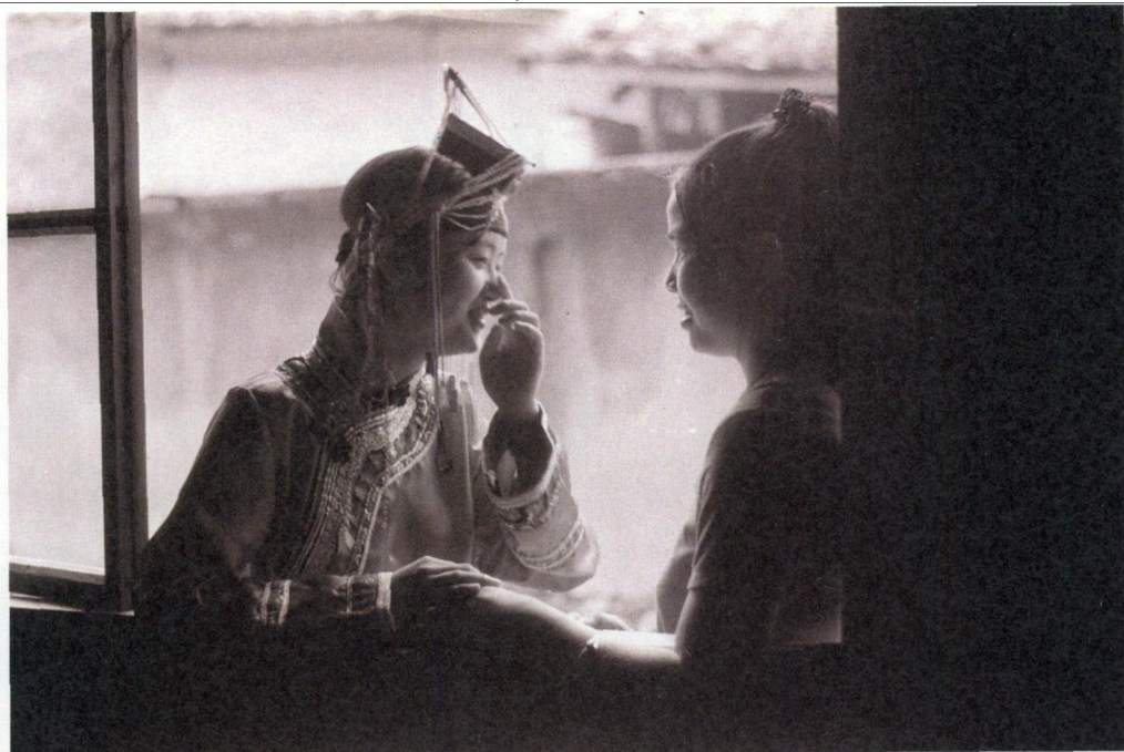
▲凤凰传奇的故事在倚窗攀谈的畲族妇女口中娓娓道来。

雕工艺刻有毛泽东及56个民族团结图案，“五星红旗”和“华表”分设鼎身两侧，底部还以祥云底纹加以衬托。2012年5月，在第七届海峡工艺博览会上，《大团结》获得中国工艺美术“百花奖”特别金奖。