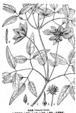
铁线莲《中国植物志》