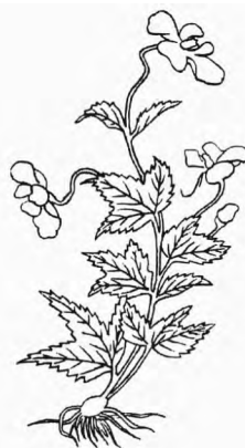
铁线牡丹《植物名实图考》