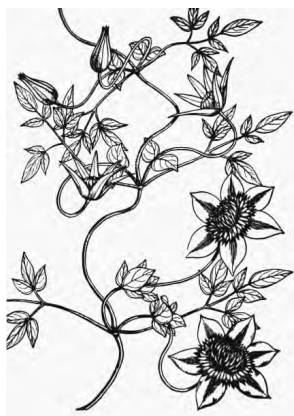
铁线牡丹《滇南本草》

“伤”与时辰关系的论述。畚药十二时辰的功能主治集中反映了畚医对“伤”的认识与治疗特色 [12] 。