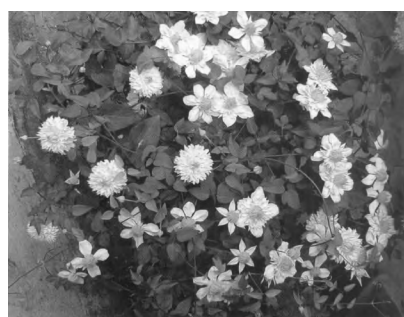
绿花重瓣铁线莲《中国花卉盆景》