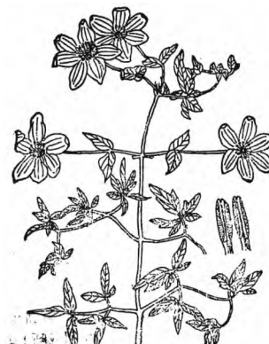
铁线莲《全国中草药汇编》