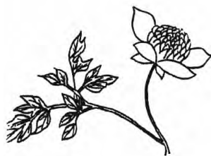
铁线莲《植物名实图考》