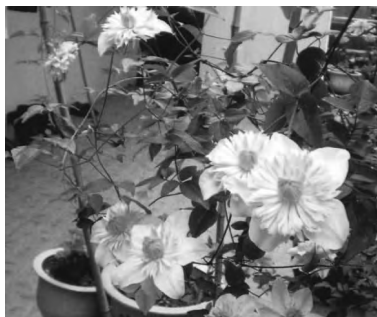
十二时辰《福安畚医畚药》