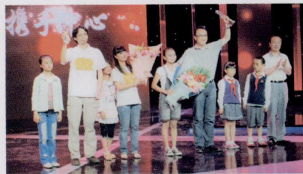
好人代表“青鸟世界”及受助学生