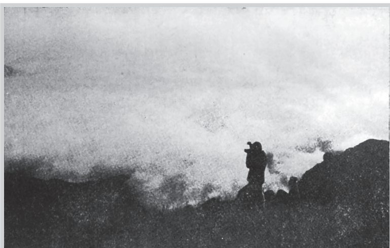
闽东第一山——白云山云海