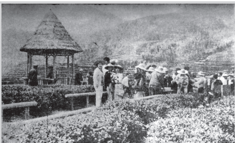
福安社口坦洋茶区