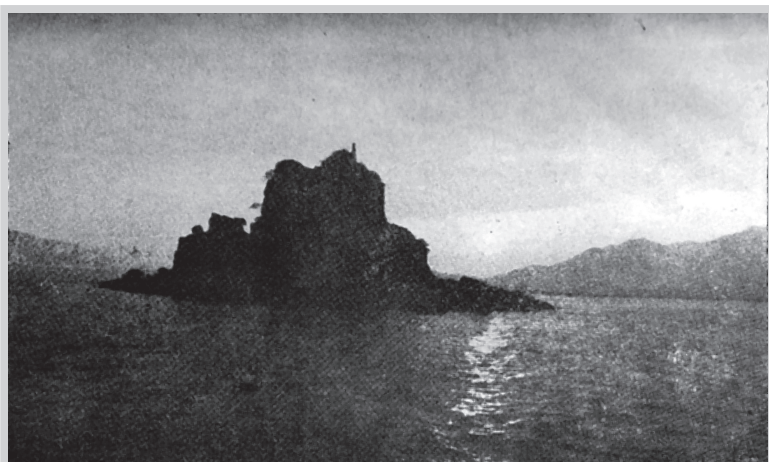
东海一角——福安下白石海区