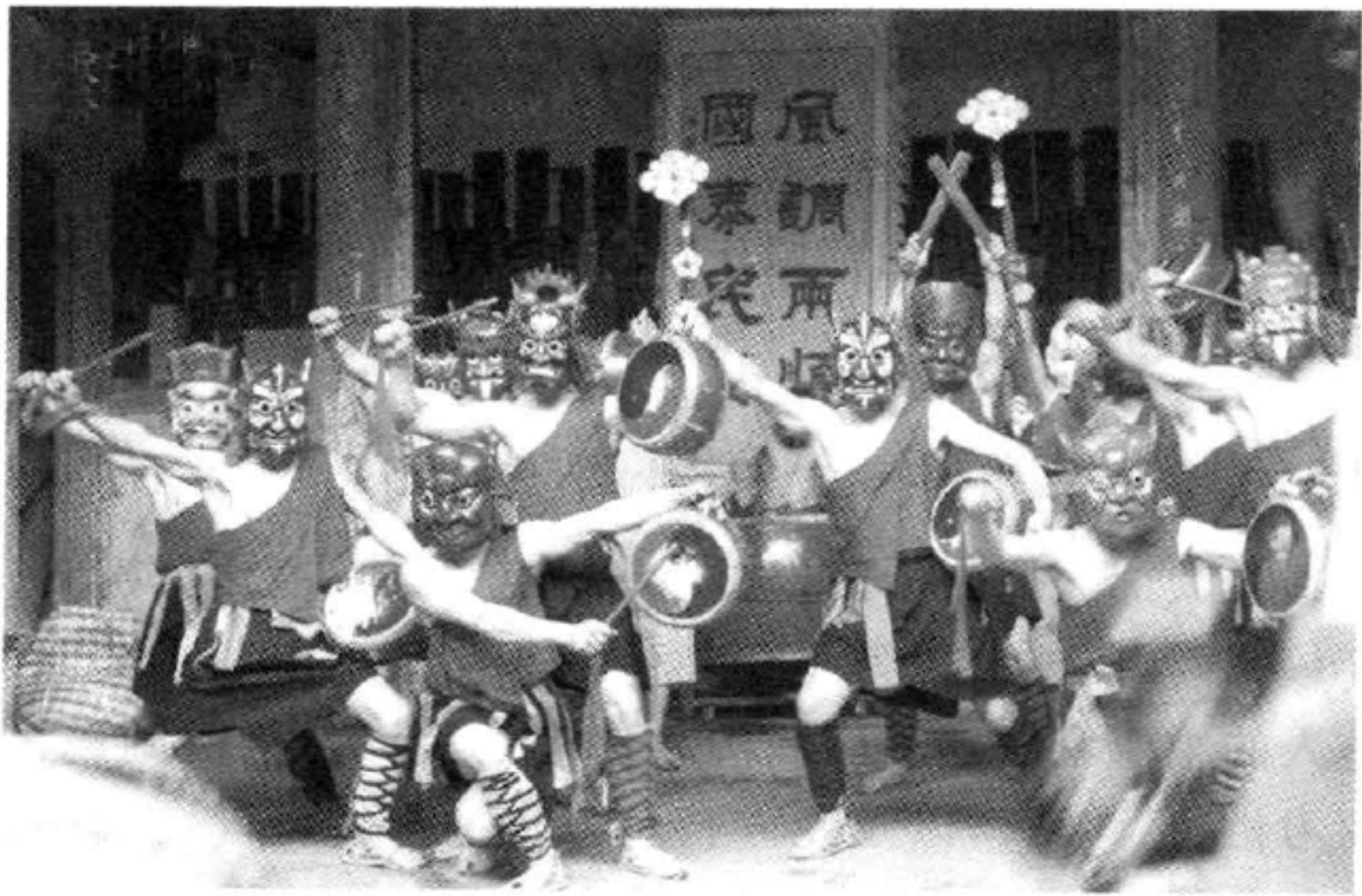
图 7-4 闽北傩舞

“文化走廊”，中原民俗文化“沉积”丰厚。例如，许多重大民间节日和在节日期间进行的民俗文化活动，基本上与中原地区一样。但是，由于历史和自然条件等诸多因素影响，一部分中原民俗文化还保留着传入时的初始面貌，如流传在邵武和建瓯的“傩舞”就是比较典型的例证。闽北在地理上与江浙毗邻，先秦时由于战争和其他因素，闽北与这些地方已经“杂俗”。秦、汉以后，中原文化进入闽北，吴、越文化也继续向闽北传播并“沉积”在这里，有的成为基本固定的民俗文化形式传承至今，有的则发生变异，在其原有的形式上产生了新的内涵。闽北民俗文化除传承着闽越文化遗风和融汇吴楚、中原以及宗教文化之外，在其长期发展过程中，还逐渐产生出一种与当地生产劳动和社会生活密切相关、具有鲜明地方特色的民俗文化活动，比较典型的有“挑幡”、“战胜鼓”、“高照”、“祭游酢公”、“喊山”、“柴头会”等。