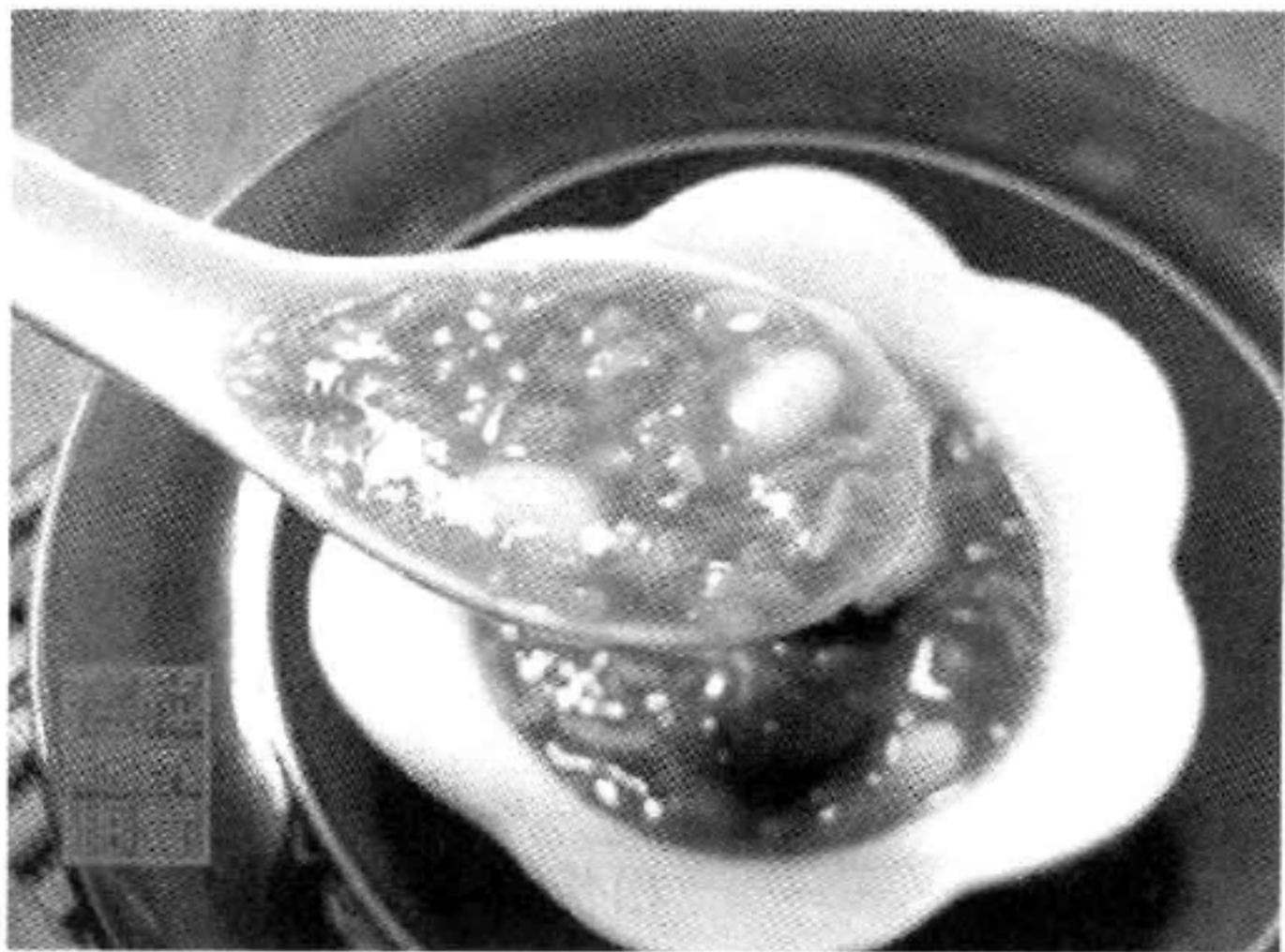
图 7-2 福州拗九粥

又称孝顺节、后九节、送穷节，俗称“念玖，送穷”。拗九节是福州地区独有的传统节日，其习俗是吃“拗九粥”，是日清晨，民间各家各户以糯米煮粥，佐以花生、桂圆、红枣、荸荠、芝麻、红糖等，熬制成“拗九粥”，先献祭祖先，再孝敬父母，然后合家以为早餐。凡出嫁女子必于这一天送“拗九粥”回娘家以示孝顺。清叶梦君有《孝粥》诗云：“怀橘蒸梨意不同，一盂枣栗杂双方。年年报哺同乌鸟，此意榕城有古风。”拗九粥的来源，民间传说不一：一说是相传目连母亲凶悍，死后被送进地狱受苦。目连长大后，每天送饭给母亲，都被小鬼吃掉，不得已煮了一碗颜色拗黑的粥，小鬼不敢食，故名拗九粥，目连送饭的日子即为拗九节、孝顺节。一说源出送穷，《四时宝鉴》记曰：“高阳氏子好衣敝食糜，是日死，世作糜粥，破衣祝于巷，曰除贫，此用其遗俗也。”清代学者林祖焘《闽中岁时杂咏》有诗云：“相传拗九届芳辰，各煮饴糜杂枣榛。扫尽尘封投尽秽，送他穷鬼迓钱神。”闽俗正月初九称上九，十九称中九，廿九称下九或后九，所以又叫后九节。此俗至今仍在民间流行。