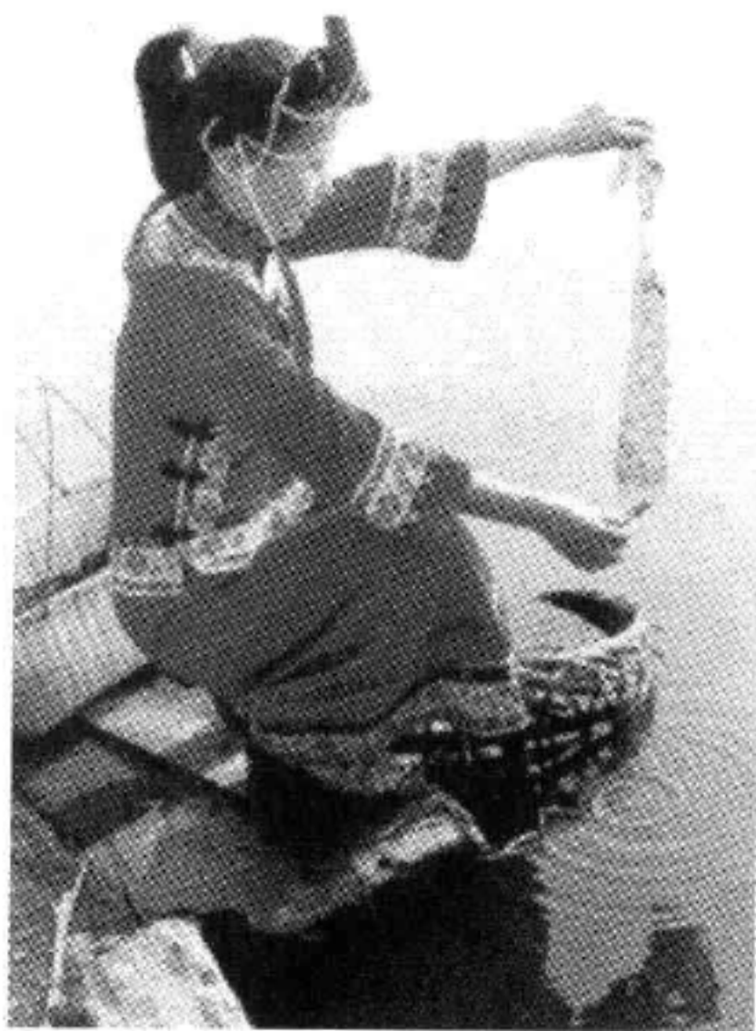
图 7-3 身着传统服饰的 畬族女性

此外,福州的民风习俗还表现在诸如民间戏曲艺术(闽剧、评话)、民间信仰(如临水夫人陈靖姑崇拜)、民居建筑及饮食文化上。