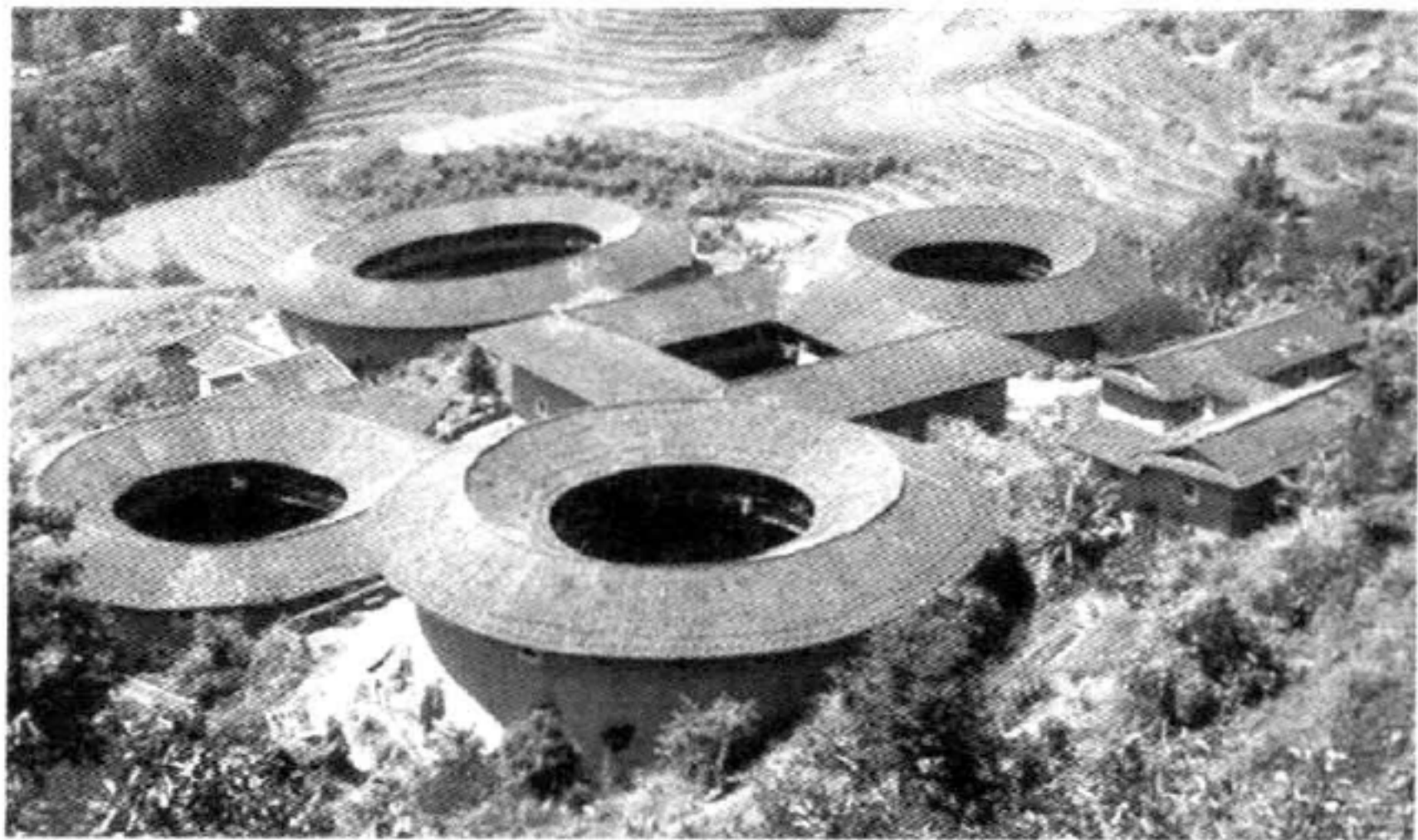
图 7-5 土楼

极图的米筛中,脱去旧鞋换上新鞋,称“过米筛”,象征辞故土创新业。接着,新娘由父亲背出家门,上车(古时用轿)后娘家人把水泼到车上,表示“嫁出去的女,泼出去的水”,在夫家扎根。新娘上车时要放声恸哭,表示舍不得离别父母,有孝心,婚后有好运,称作“哭好命”。在节令习俗上,客家人岁时节令繁多,一年有大小 35 个,如大年初一,客家人先要祭祀祖先,再到庙堂进香,在说话做事上也有许多禁忌;初二有“新正祭墓”的习俗,各家各户备上三牲、香烛上祖坟祭扫;初三是“穷日”,一般不出门;初五“开小正”,开始生产经营活动;初七,妇女们早出采集菠菜、芹菜、茴香、葱蒜、韭菜、芥菜、白菜等 7 样菜,共煮而食,以求勤劳聪明、发财得利;正月十五,庆元宵,“开大正”,各行各业全面恢复正常。在饮食习惯上,客家食文化的一个突出特点是菜肴丰盛、味道浓郁,多大锅菜,此外还有各种干菜。客家人非常重视聚族而居的传统。回龙屋与大型的、封闭式的土楼最集中地反映了他们同族聚居的特点,一般土楼的平均居住人口都有上百人。