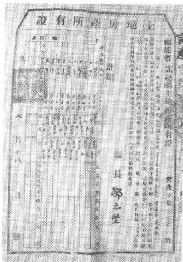
图 3-24 蕉城区飞鸾镇长园村 保存的畲族契约原件