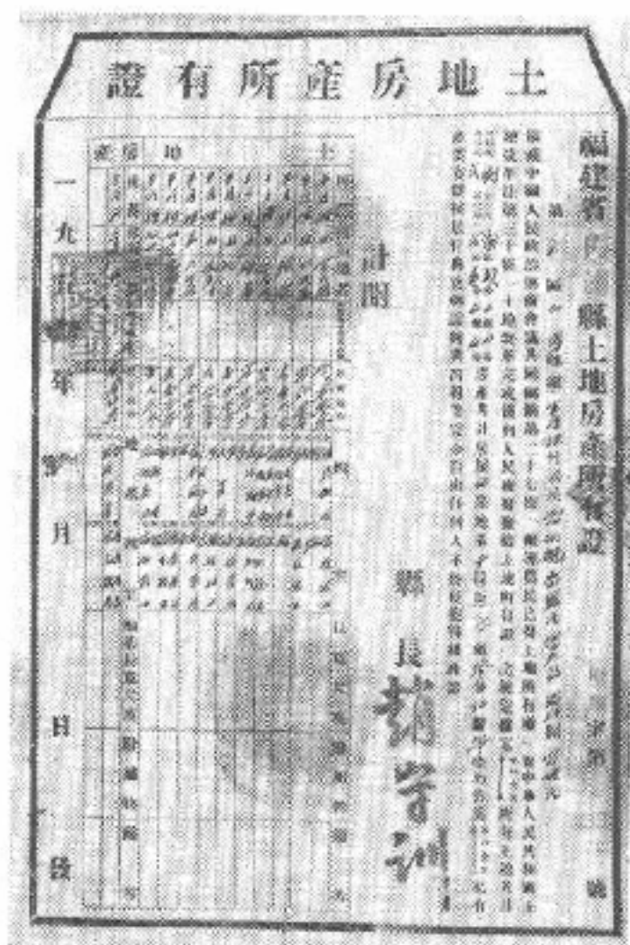
图 3-25 霞浦县溪南镇半月里自然村 保存的土地证照片

金贝、廷坪、金涵、琼堂、院后、中前，漳湾雷东，七都滌头、外洋、北山，八都南岗、猴盾、大坪、半山、新楼、韩丹，九都九仙、柴坑、乌坑，霍童小石，赤溪松岭，飞鸾南山、向阳里、新岩、蒲岭；福鼎秦屿财堡、方家山，白琳牛埕下、康山，硖门瑞云，桐城浮柳、岔门，前岐龙头湾、桥亭、佳阳、象阳、双华、罗厝、佳山；霞浦盐田瓦窑头、洋边、二铺、西胜、南塘、尤澳，崇儒新村、上水、霞坪、溪坪、苋下、半路张、岚下，水门茶岗、半岭、大瀾、长湖、青澳、七斗岔，三沙东山、单斗、三坪、二坑，柏洋西坑、大岭、阮洋、斗门、一层、茶坑、凤江，洲洋青福、墓斗、岭头、马洋、八斗贝、大沙、七宝洋，沙江大墓里、大坪、龙湾、小马，长春法华，下浒四斗，北壁盘前，溪南南门山、白露坑、后慕；福安市城阳铁湖、白坑、茶洋、纸坪，坂中日宅、林岭、亭兜、和安、彭加洋、井口、后门坪、许洋、大林、仙岩，上白石南山头，溪尾林洋、坎下，松罗后洋、小茶洋、王棣、大坪里，溪柄白沙、东坪、长洋、彩花桥、龙潭面，湾坞坑源、梅洋、寒洋、半岭、岩下、福岭、池头、宝林、半屿，福口坑里坑、潘洋、山里、上山、牛山湾、荣岭头、利岔、大坪、谢岭下、潭头鹅山，穆云上洋、科后、虎头、中沃、外厝、温岩、燕坑、岭坑、王楼、梨田、竹洲、南山、高岭、燕科、溪塔、洋坪，下白石章岭王坑、下赤、金腰带、通湾洋、亨里、秦坎、章坑、坑门，康厝半山、竹沃、红坪、东山、凤洋、长潭、金斗洋、秋岭，溪潭马山、仙石、蓝田、岐山、下庄、瓜溪，甘棠坑门里、春雷云、岭尾、北山、山头庄、小岭、过洋、何厝；古田平湖富达，大桥梅坪，凤都新建；屏南甘棠巴地，寿宁斜滩外洋；周宁咸