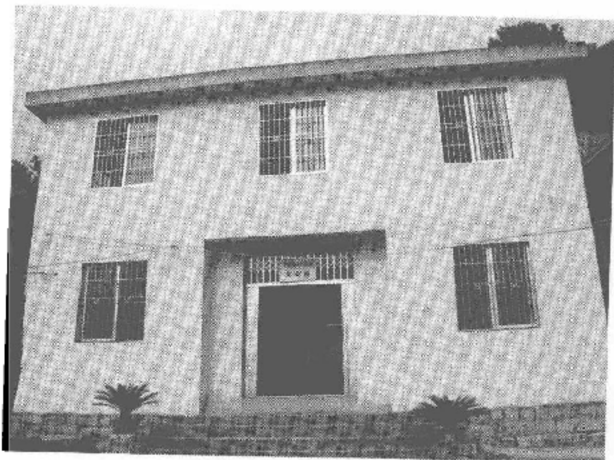
图 5-2 蕉城区猴盾畲族文化站

1956 年创办。1984 年县文化主管部门、县民族事务委员会、八都镇政府、猴盾村党支部共同筹款 1.8 万元，划给土地 250 平方米兴建文化站大楼，同年 12 月完成第一层工程交付使用。内设图书室、阅览室、模艺室、电视室，并成立有畲族流动电影放映队。1985 年文化站站长调离后，由一名临时工代管，后被降级为村级文化站后经蕉城区民族部门争取，1996 年，重新认定办公办文化站，人员列入事业编制，文化站除开展一般性文娱活动外，每年都要组织体育竞赛和三月三歌会等活动，为丰富畲族群众的精神文化生活，保护与发掘畲族文化遗产作出了积极贡献。文化站的建立为发掘畲族文化遗产、开展文娱