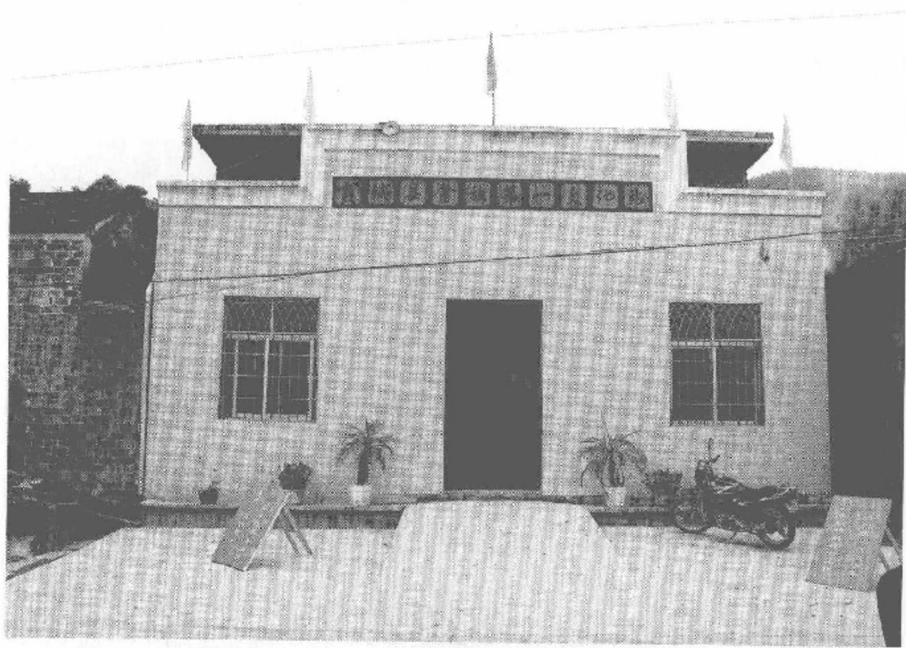
图5-4 霞浦县南塘畬族第一文化站

在海边村，活动房舍面积40平方米。为当时省内6个公办少数民族文化站之一。配有1名管理人员，年固定经费2000元。1959年新建砖木结构楼房一座，建筑面积800平方米，活动场地110平方米，设有报刊阅览室、图书室和游艺活动室，拥有报刊、图书、文娱器具和一副文化担（装有留声机、幻灯机、广播筒、图书画报、展览图片等）。青蛟畬族文化站（后改办南塘文化站）多次获得表彰，《民族画报》和《福建日报》均报道过该站事迹。1964年青蛟闽剧团赴京参加全国少数民族文艺会演，演职人员受到周恩来总理接见。“文化大革命”期间，文化站管理人员被调离，不久停办。20世纪80年代后，多次申请重建文化站未果，2004年，宁德市人民政府下发《关于恢复畬族文化站的意见》将南塘畬族文化站列入全市5个重建站点之一。2006年建成钢混结构二层建筑面积平方米的文化站大楼，命名霞浦县第一文化站。