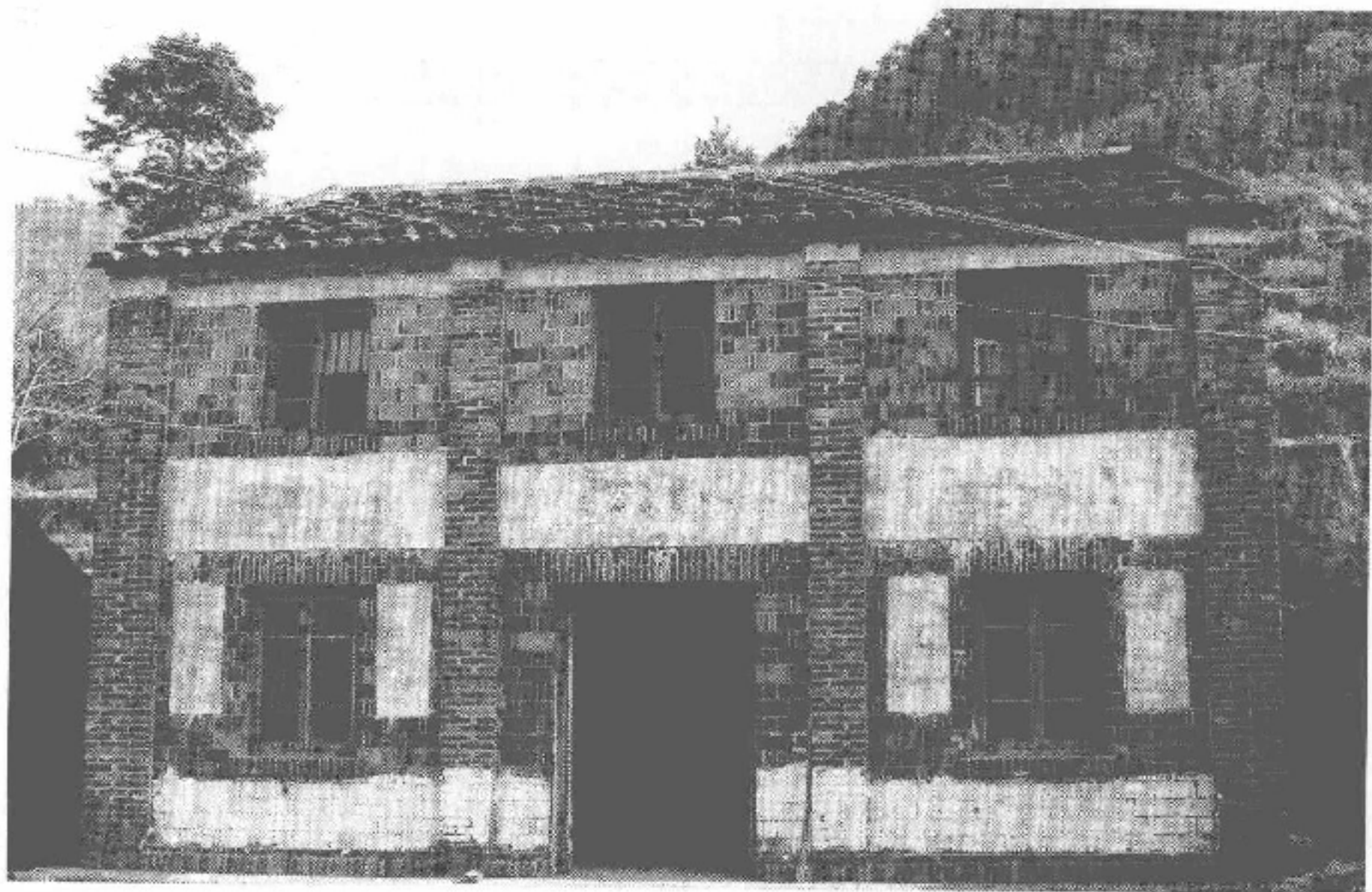
图5-3 福鼎市双华畲族文化站