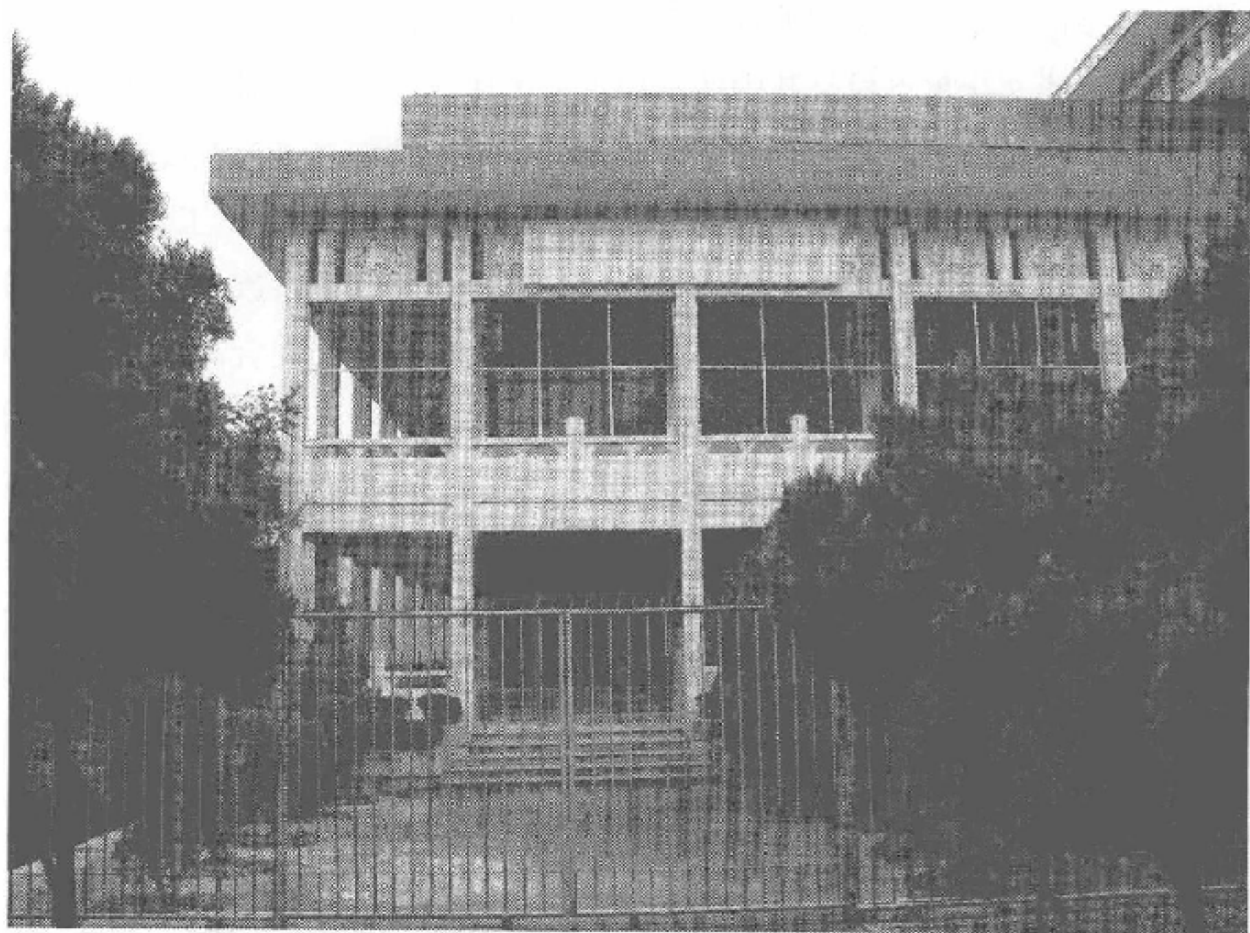
图5-5 闽东畬族革命纪念馆

战歌。据不完全统计,自1986年筹建以来,到闽东苏区纪念地接受爱国主义教育和革命传统教育的党政机关干部、企事业单位和中、小学校学生在100万人次以上;在今年开展的中国共产党保持先进性教育活动中,这里共接待前来参观瞻仰的人数达56 000多人。