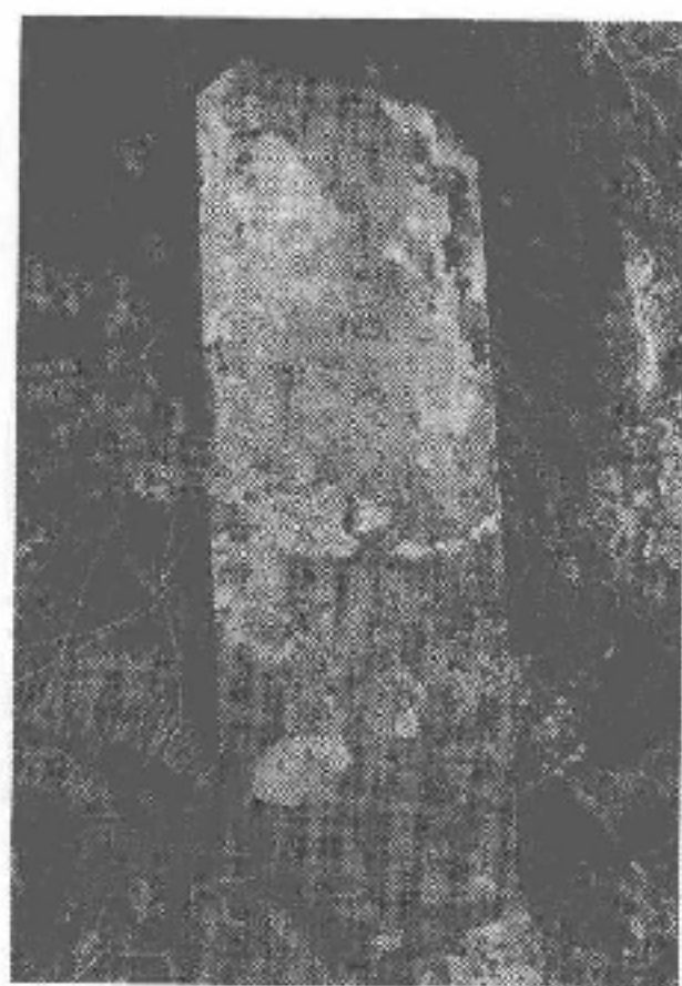
图 4-3 济川桥桥碑