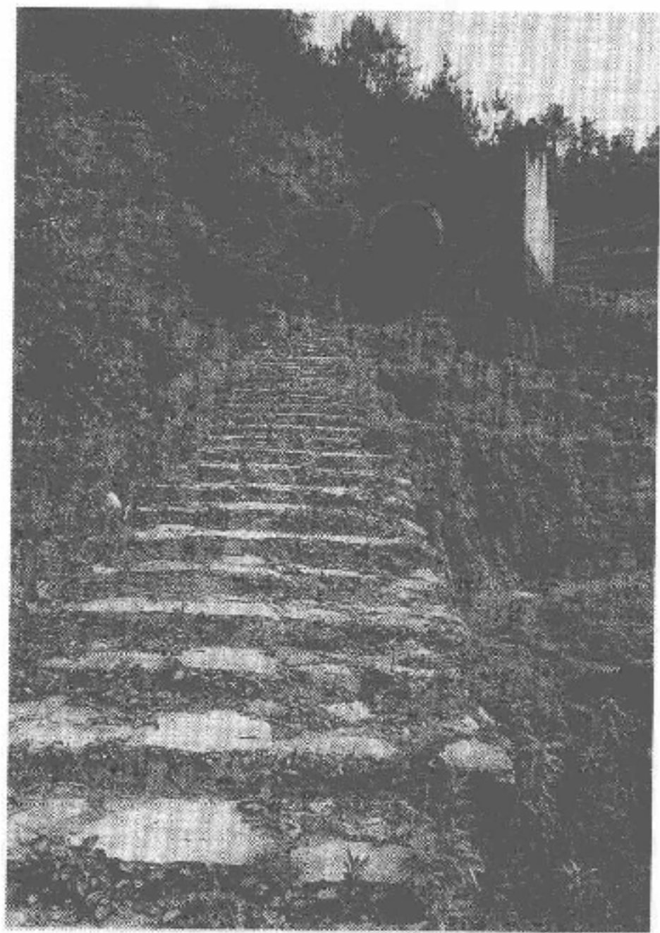
图 4-5 林岭古道