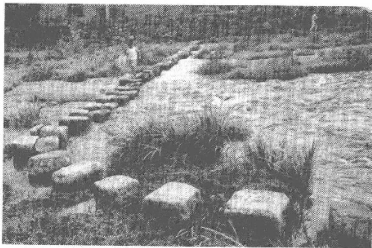
图 4-4 新村矴步

位于霞浦县崇儒畲族乡新村东南有座矴步桥，为霞浦县现存矴步桥中历史最为悠久、跨度最长的一座。始建年代无考，但实行科举制以来，此桥便是入京赶考的唯一官道。桥全长 51 米，计 53 步。石齿面长、宽各 0.26 米左右。以两块上高下低方整石拼合，出水高约 0.3 米，齿距 0.25 米。这个矴步桥有两个特点：一是呈“L”形，二是在其上游约 30 米处又造了“一”字形的相同规格矴步桥。