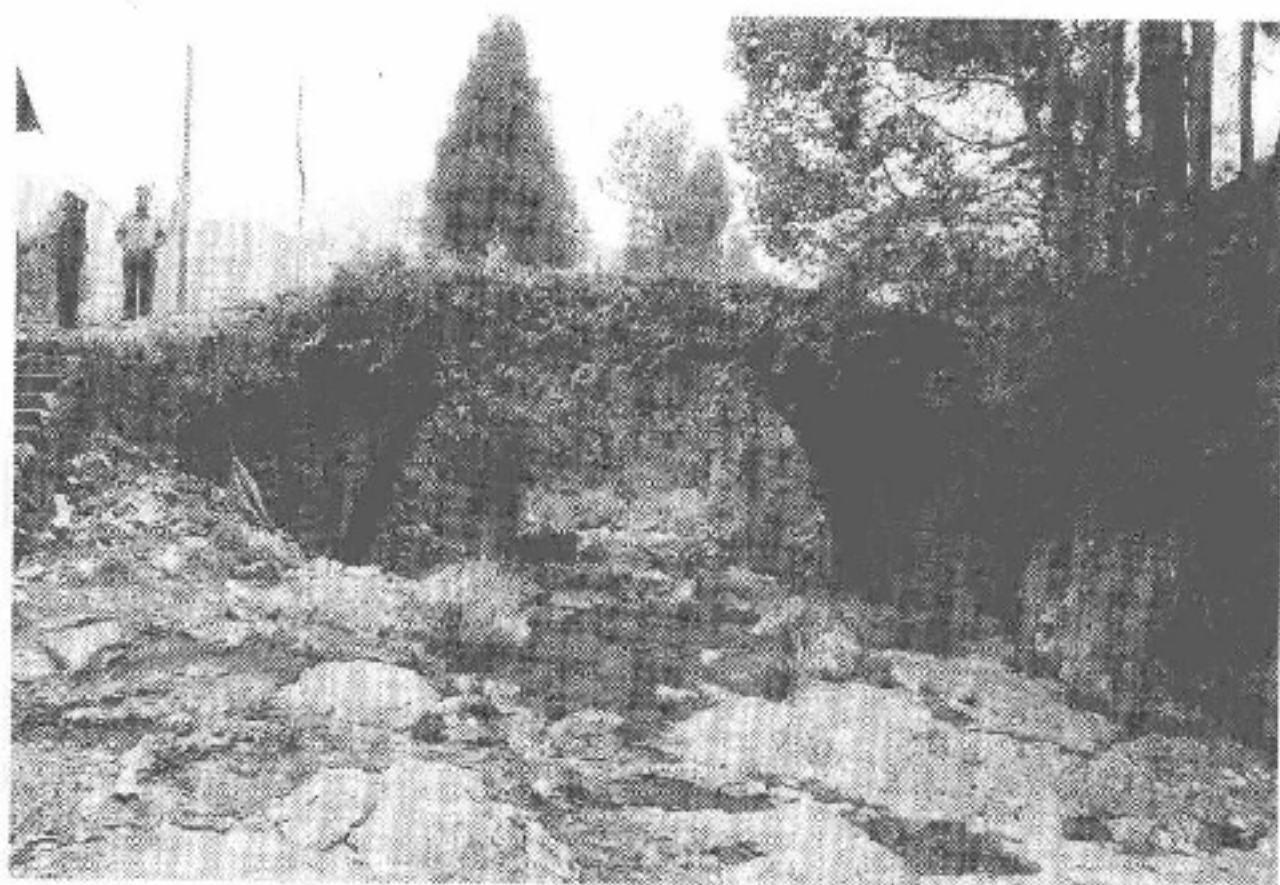
图 4-2 济川桥