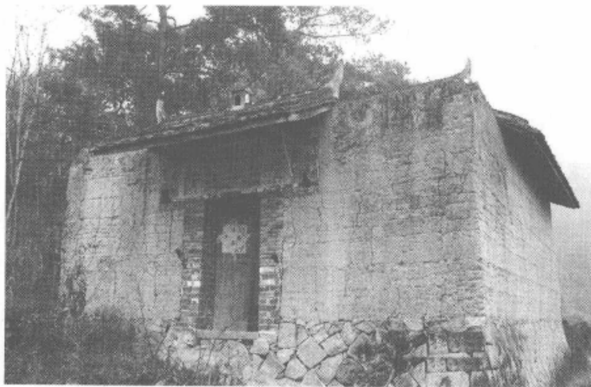
图2-97 福安市穆云乡长潭村五显帝宫

长潭五显帝宫，位于福安康厝长潭村。宫深10米、宽7米，建筑面积70平方米。供奉主神五显灵官大帝、林公大王、陈靖姑等三位太后元君、当境土主雷法全等。每年五祭。