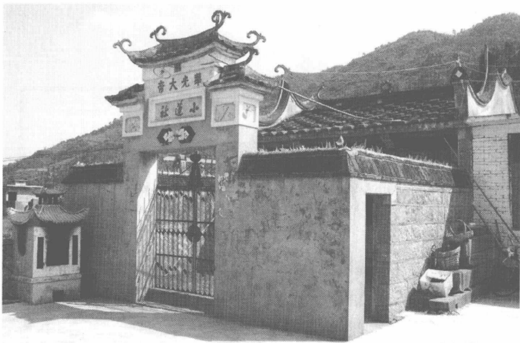
图2-96 福鼎市秦屿镇洋里村华光宫

洋里华光宫，位于福鼎秦屿洋里村。始建于年民国期间。石构，占地面积108平方米，建筑面积60平方米。主神为华光大帝、牧牛童等。