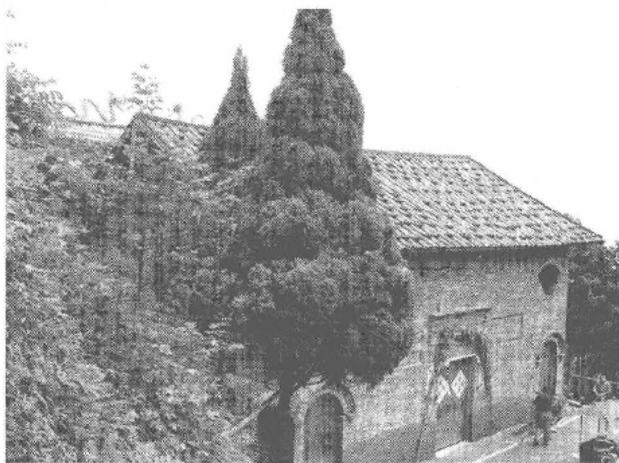
图2-94 福安市坂中畲族乡仙岩村五显帝宫

仙岩五显帝宫，位于福安市坂中畲族乡仙岩村，供奉神像为五显帝、忠平侯王、陈靖姑、当境土主、土地公等。宫始建于清道光六年（1826年），先后重修于民国十五年（1926年）、2002年10月。宫进深24米、面宽14米，占地面积350平方米，建筑面积276平方米，戏台面积30平方米。主神为五显帝。相传清