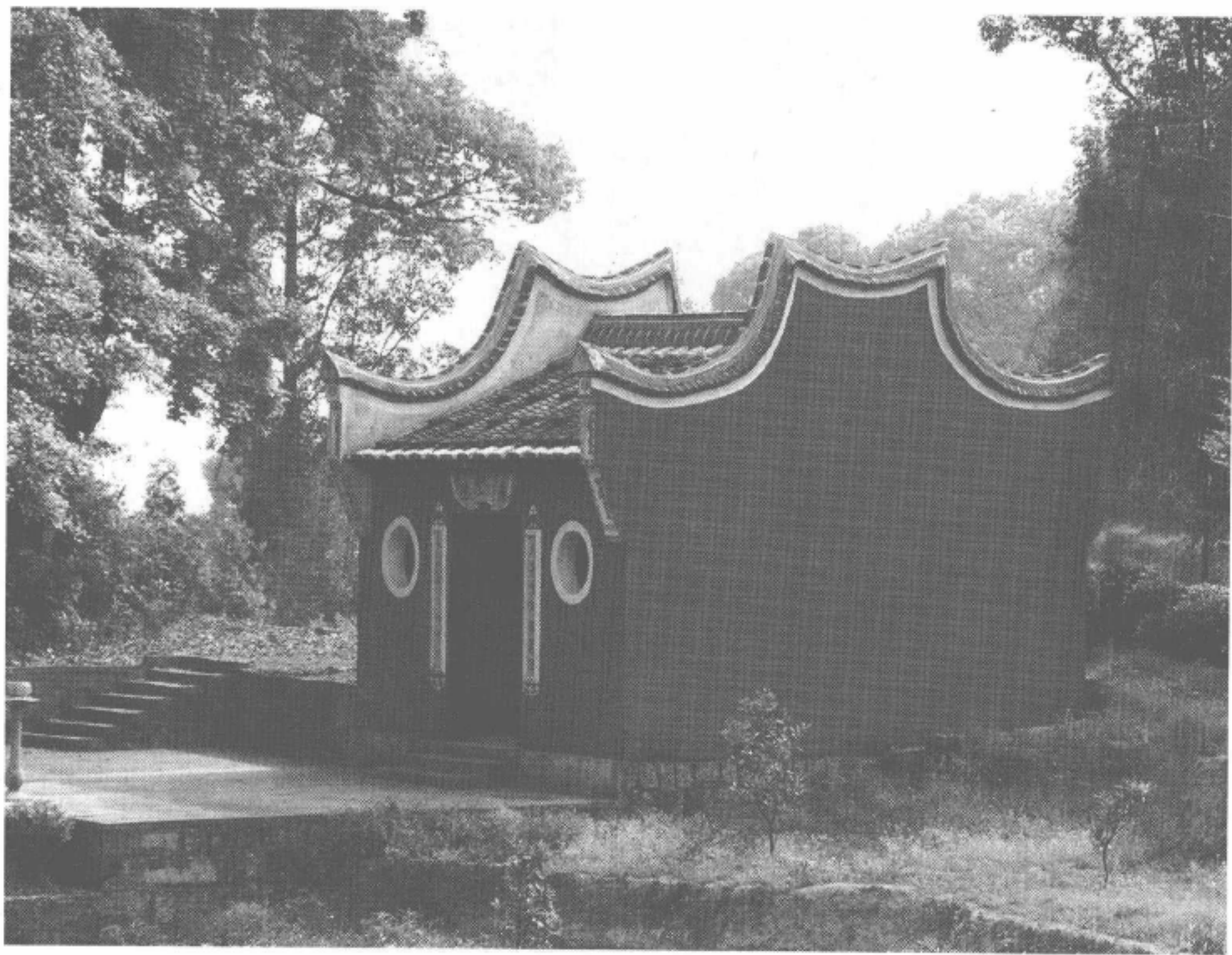
图2-91 蕉城区金涵畲族乡上金汲齐天大圣宫

上金汲齐天大圣宫，位于蕉城区金涵畲族乡上金汲村后山。深4.5米，宽4米，建筑面积18平方米。供奉齐天大圣。