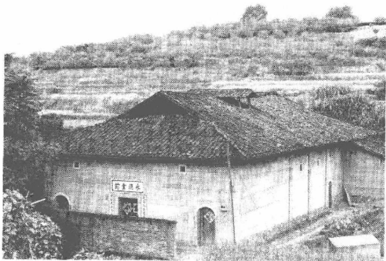
图 2-92 福安市康厝畲族乡金斗洋村华光宫

金斗洋华光宫，位于福安市康厝畲族乡金斗洋村口，下临小溪。始建于清乾隆初年（1736年），1978年重修。华光宫坐西北，面朝东南，建筑面积325平方米，深26.5米，宽14.5米；有戏台，深7.6米，宽6米。供祭神像为五显帝、平水大王、平水小王、雷大三十二公等，主神为五显长生大帝。每年正月初五日致祭。