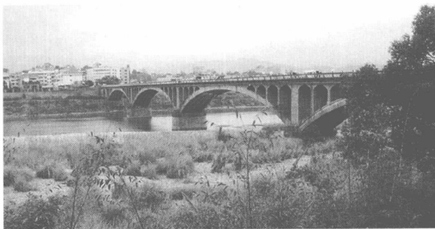
图 1-5 建于 1982 年的连接福安市区与坂中畬族乡的坂中大桥