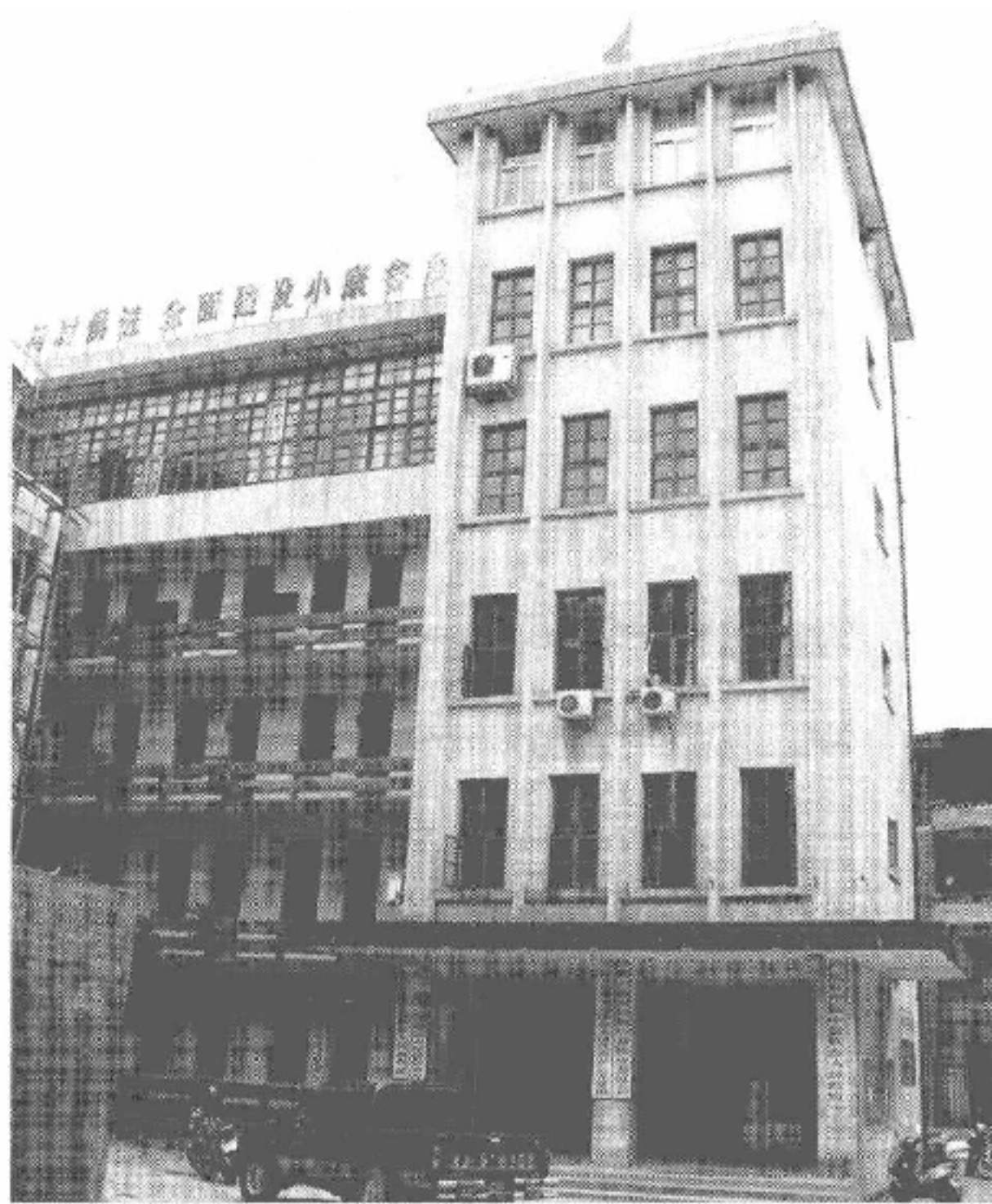
图 1-2 坂中畲族乡政府办公大楼

2000 年起，加大农业投入，建成农业生产示范基地、丁香橄榄生产示范基地和生猪养殖基地各 1 个，种植水果面积 6000 多亩，蔬菜面积 8000 多亩，为农业增产农民增收打下了坚实的基础。2005 年年末，耕地面积 14500 亩，当年实际机耕地面积 10370 亩，年末有效灌溉面积 8407 亩，农村经济总收入 110835 万元，农林牧渔总产值为 7562 万元，乡企业营业收入总额 132815 万元，乡企业净利润总额 5130 万元，实交税金总额 4095 万元，乡财政收入 640 万元，全乡村民人均纯收入 3842 元，少数民族人均纯收入 3332 元。乡办企业以机电行业为主，有厂