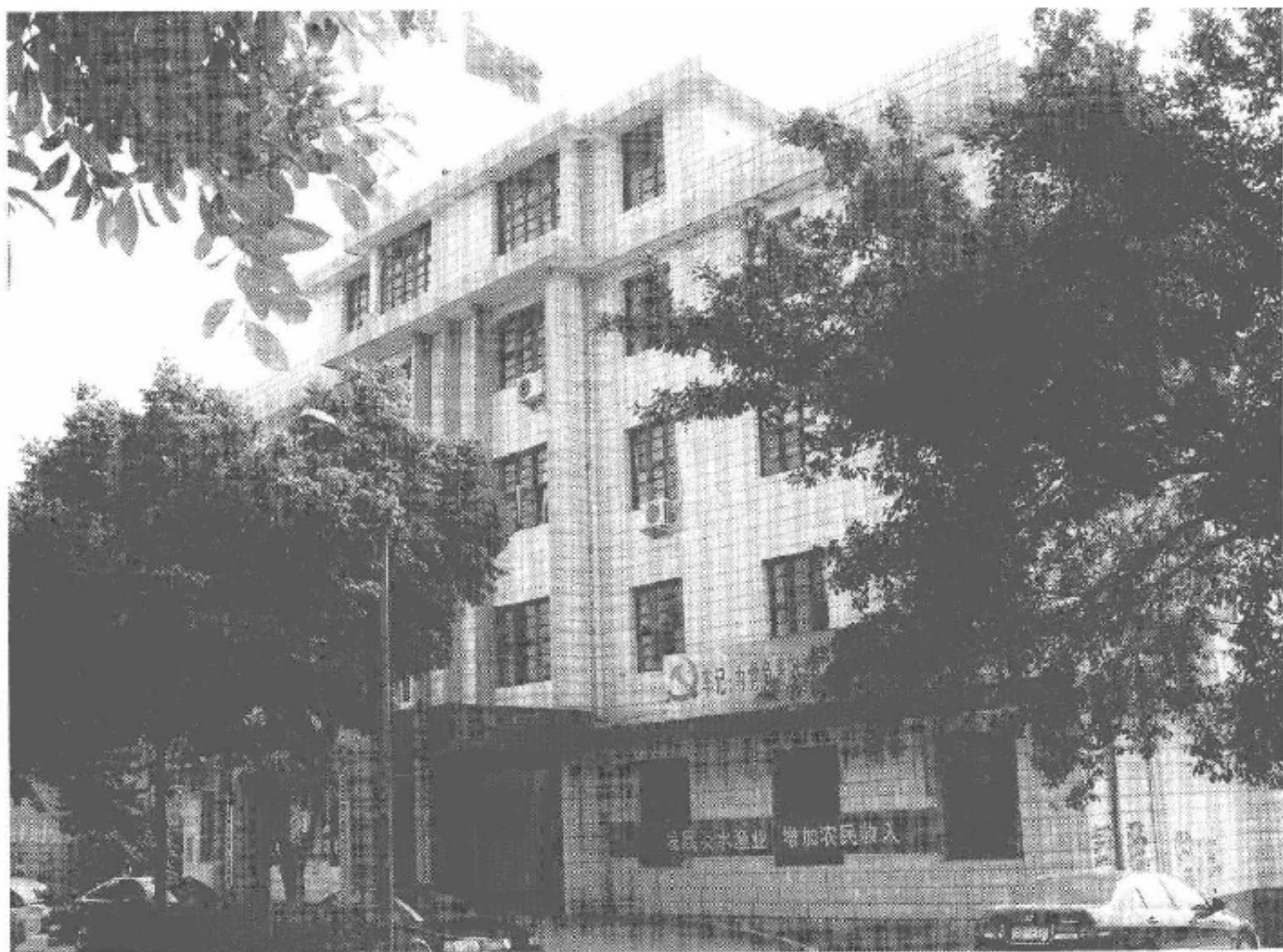
图 1-9 康厝畬族乡政府办公大楼

康厝畬族乡，明、清时期属福安县钦德里。民国时期，属福安县穆阳区。新中国成立初期，亦属穆阳区。1962 年，建立穆阳区康厝小公社，辖 12 个大队。1966 年改设康厝人民公社（大公社，和区同级），下辖 22 个大队，189 个生产队。1984 年撤社建乡，同年 9 月建立康厝畬族乡。