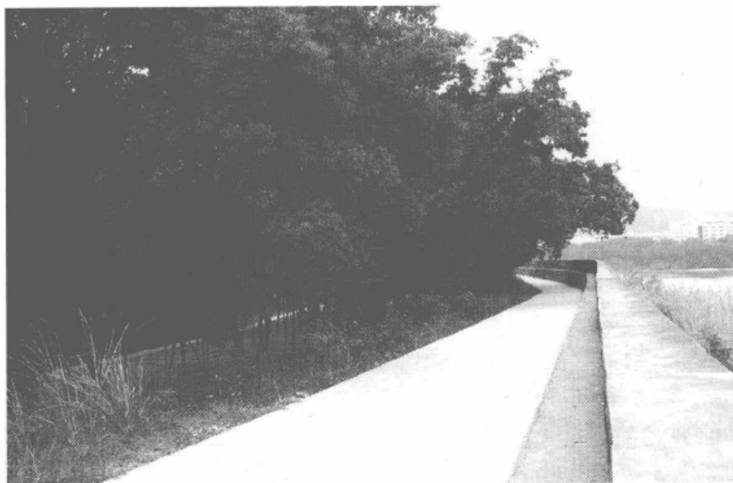
图 1-6 坂中畬族乡防洪堤