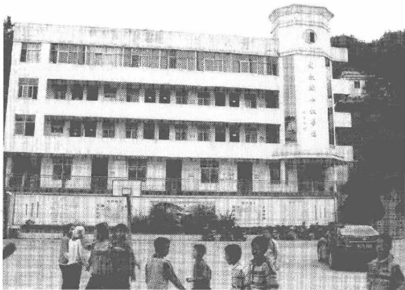
图 1-3 民族实验小学

坂中畲族乡 1982 年竣工的钢混三墩四孔双曲拱坂中大桥与福安市区相连接。先后建成乡际公路 3 条，总里程 48.4 公里；村机耕路 16 条，总长 50 公里。全乡有 13 个村通公路，有 4 个村 46 个自然村通机耕路。乡所在地的坂中村主街道和宽 24 米新街，全部铺设水泥路面。乡建有水电站 1 座，装机容量 500 千瓦。2005 年 19 个村全部实现通公路、通电、通水、通电话、通邮、通电视和有线广播，电话用户 3800 户。办有仙岩村畲族文化站 1 所，面积 320