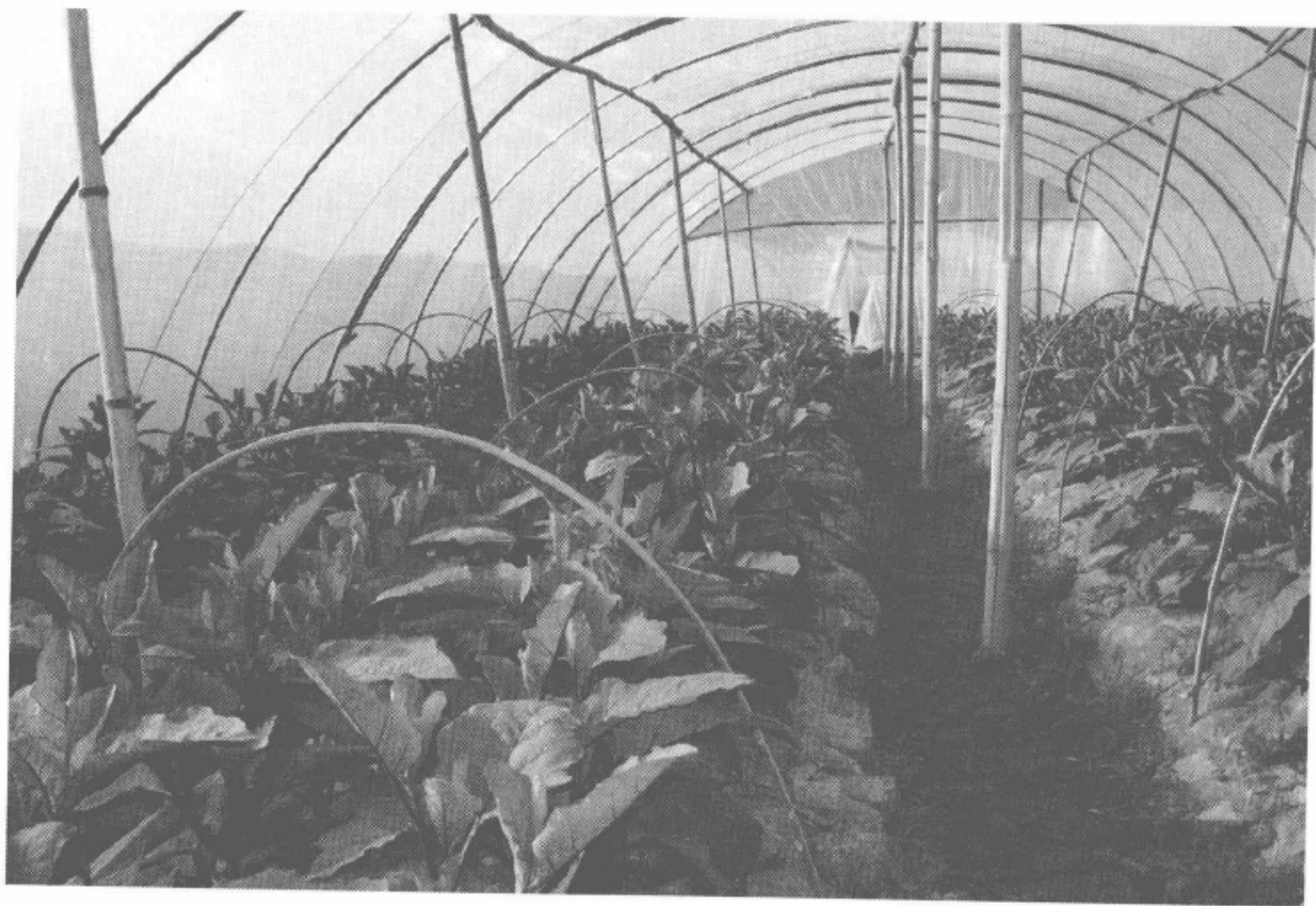
图 1-8 坂中畲族乡棚栽蔬菜 (宁德市民宗局供稿)