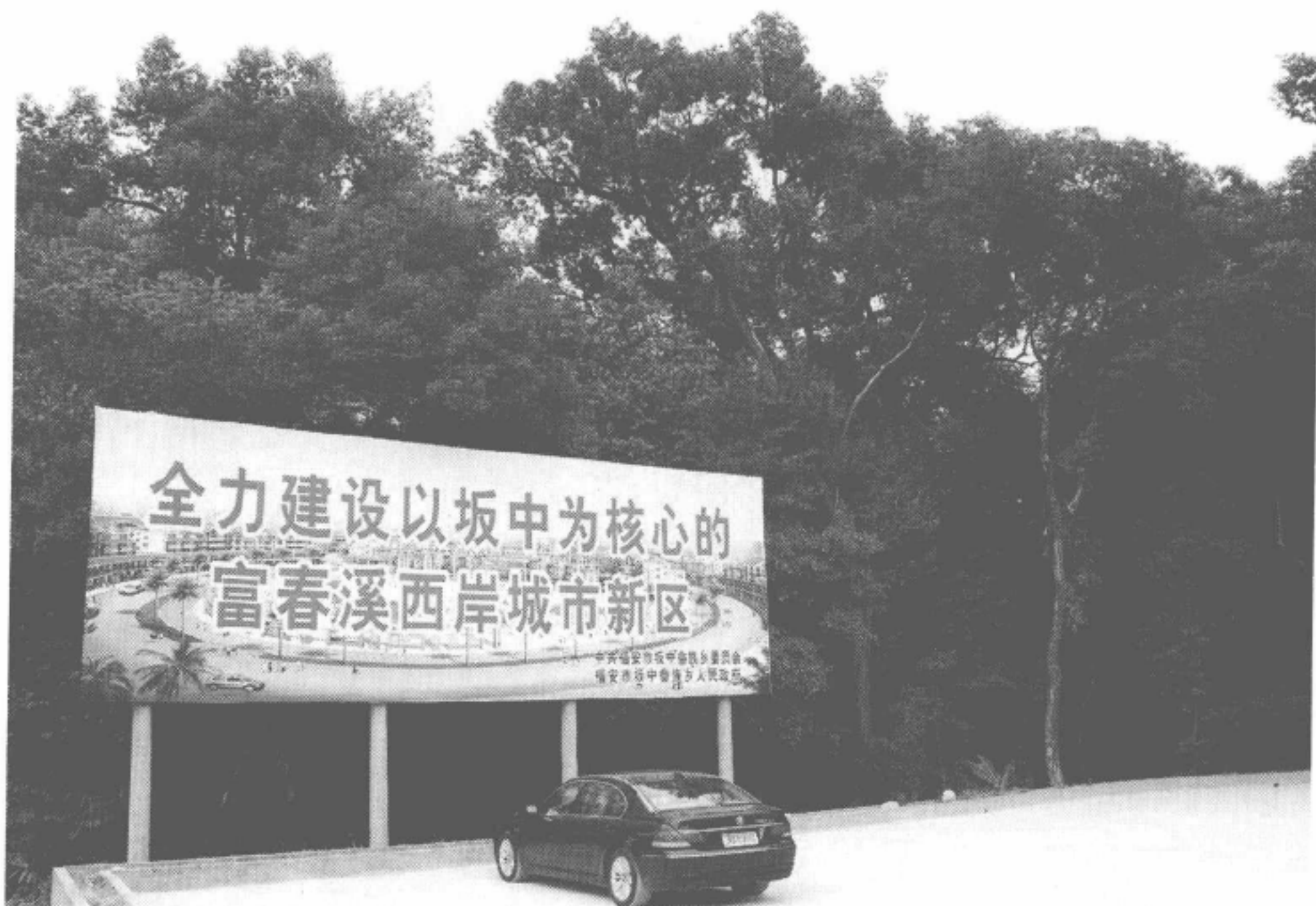
图 1-7 坂中畲族乡森林公园