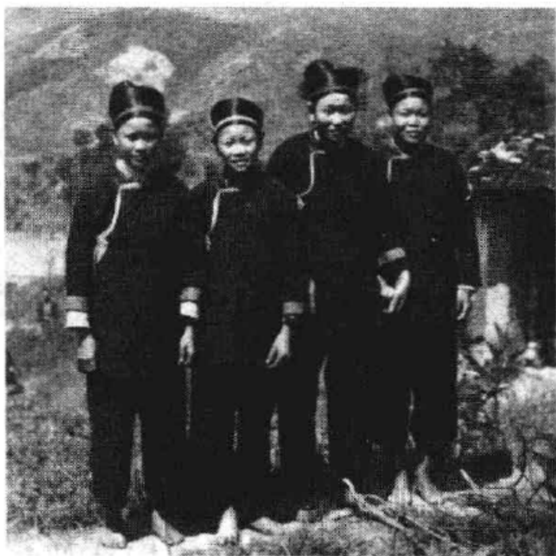
福安畬族妇女装 1956年摄

历史上畬族是一个以血缘、地域、部属为纽带而组成的具有共同民族意识、文化、语言和历史渊源的多姓氏民族。畬族