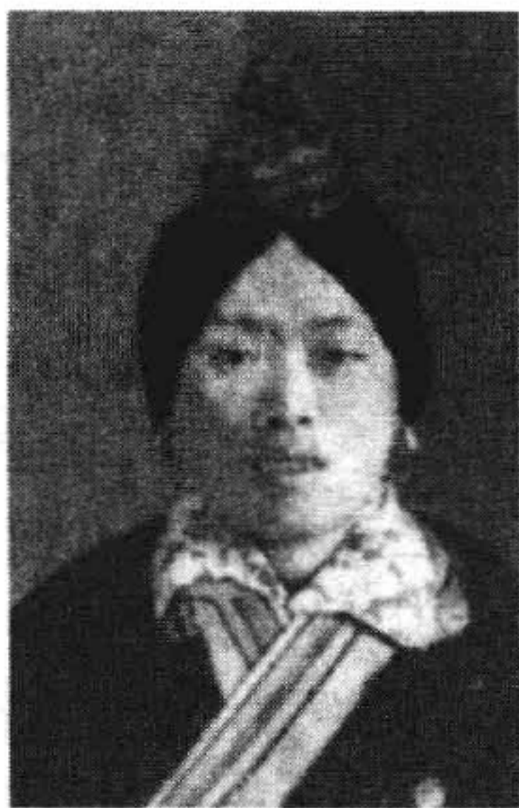
罗源畬族妇女装 1955年摄

的姓氏就有盘、蓝、雷、钟。现时福安境内畬族姓氏有蓝、雷、钟、吴、杨。福安境内为什么无盘姓畬族,而又多了吴、杨两姓?据福安畬族内传,早在过海迁徙中,盘碧玉所乘之船被风刮到番邦去了。吴姓是招来的女婿,杨姓是义子。