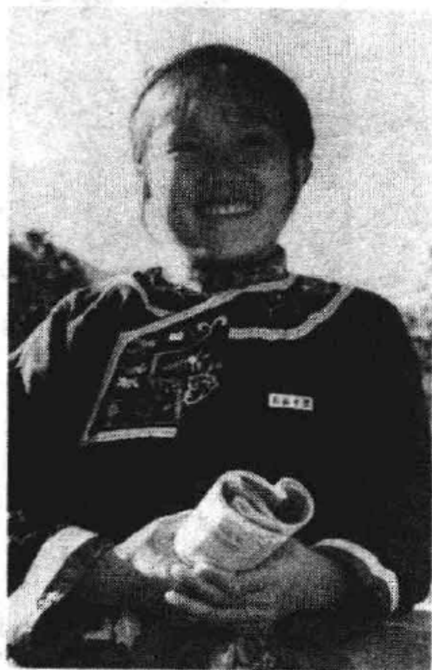
新一代的畲族中学生 1961年夏念长摄 宁德地区民族中学提供照片