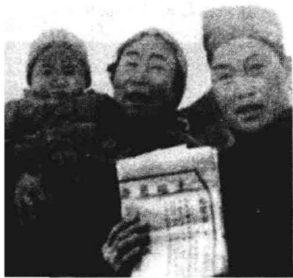
畚族群众喜洋洋地领到人民政府颁发的土地证。1951 年摄

畚族向汉族地区的迁徙过程是相当复杂的。而且又没有固定路线。畚族迁入闽东应在南宋以前，其族谱记载在唐末五代已有