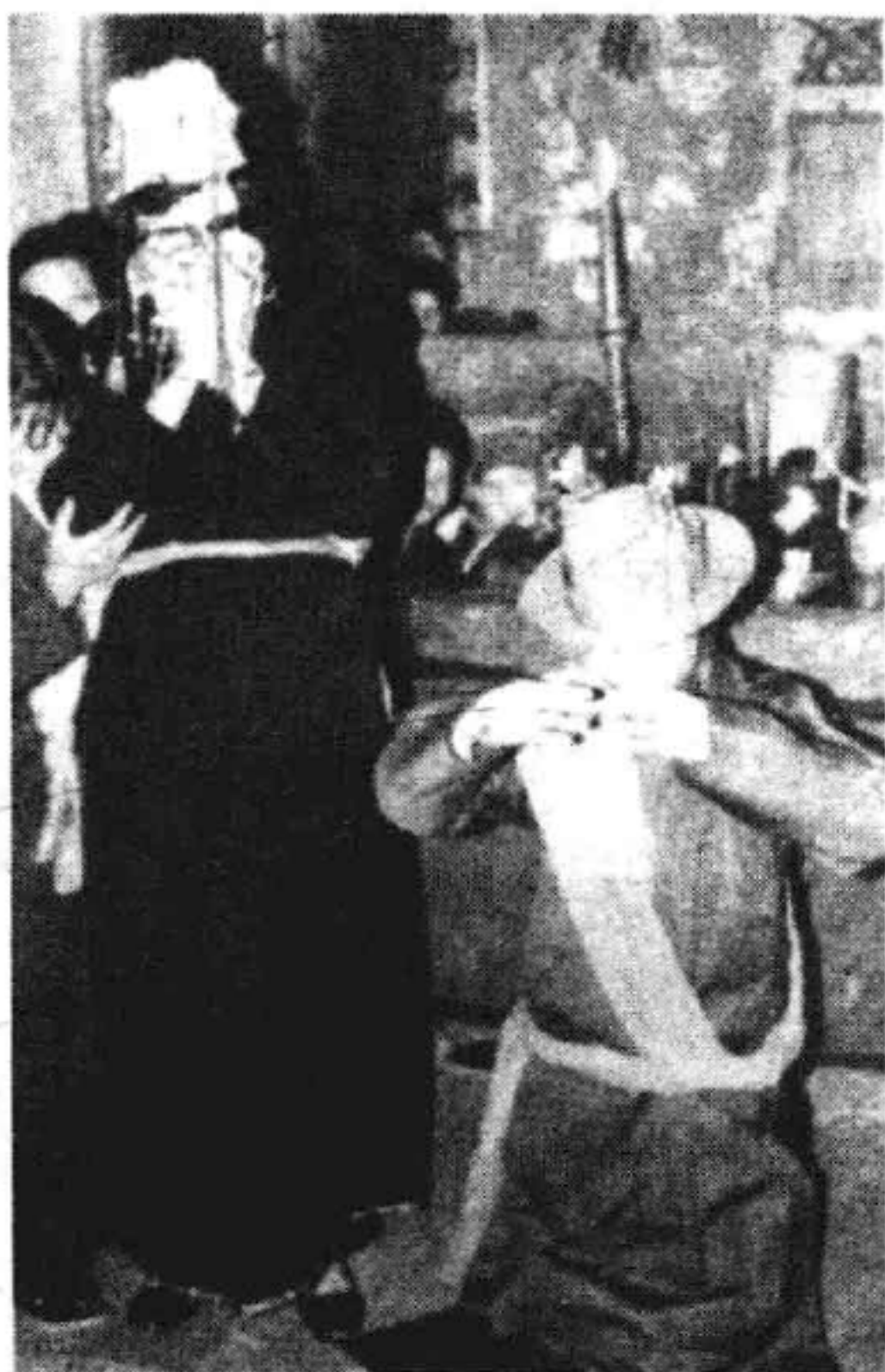
畚族婚礼中的拜堂场景

这张畚族婚礼照片的拍摄年代和摄影师，现已无从查考。六十年代前畚族婚礼中的拜堂有一种神秘感，按常理是不可能摄到的。我们暂且回避这些问题。看照片，从新郎跪拜和新娘站立验证了儿时的所闻。据说畚族祖婆是高辛皇帝的公主，皇帝特准她在婚礼上可免三跪九叩礼，这就成了男拜女不拜的风俗。高辛氏，即帝喾，传说中古代部族的首领。