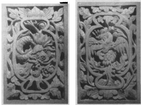
△砖雕(近代)·福建晋江