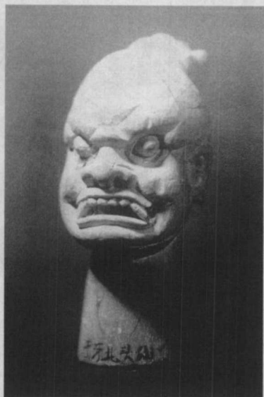
△木偶头(清)·福建泉州