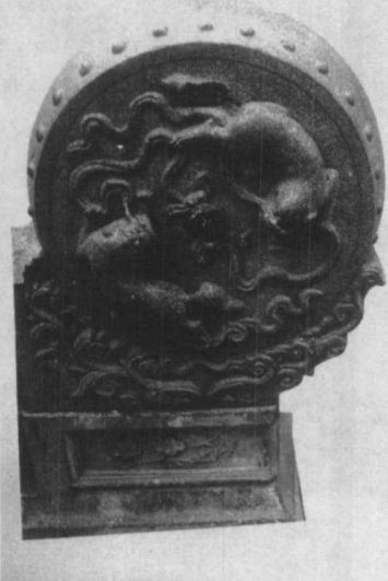
△双狮戏球石鼓(清)·福建莆田