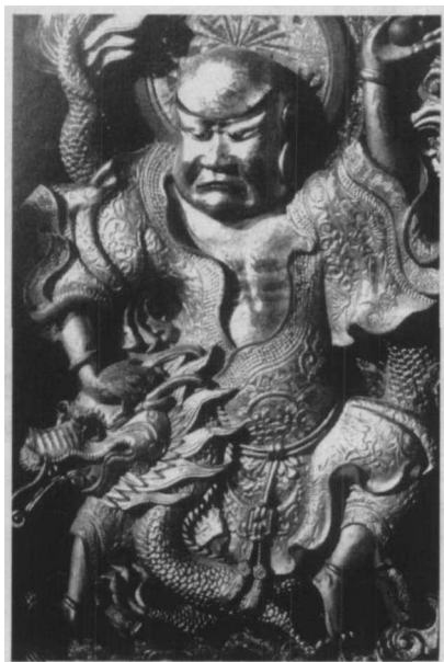
△庙门木雕(清)·福建霞浦