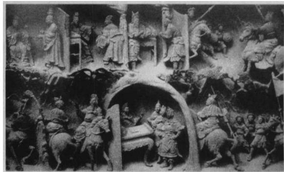
△故事连环雕(近代)·福建厦门