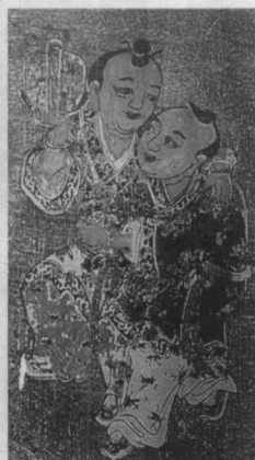
年年添丁·福建漳州

游活动以促进民间工艺美术的生长源;抓紧民间艺人抢救、挖掘、整理工作,培养新人学习民间工艺美术技艺,这种培养要结合活动、展览、市场营销等。立足传统,显现民族性,又要跟上时代。