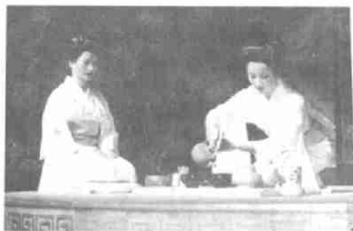
安溪县茶艺队摹拟表演的日本茶道