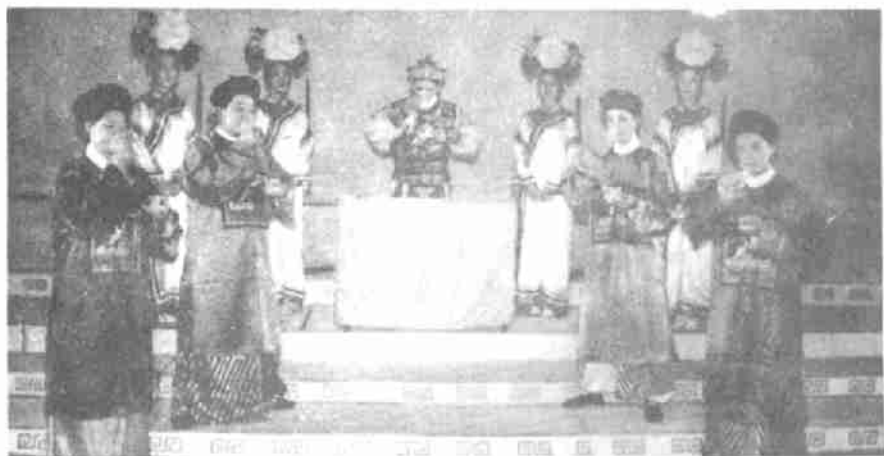
安溪县高甲戏剧团表演的茶艺小品“清宫茶宴”

清代的宫廷也要各地进贡最好名茶给皇宫使用。清朝皇帝也特别喜欢喝茶,乾隆皇帝曾经说过“君不可一日无茶。”但是一般人只知康熙皇帝给碧螺春茶起名、乾隆皇帝与杭州龙井村“十八御茶树”的故事。却有很多人并不知道乾隆皇帝与铁观音的故事。到底是什么故事?请看最后一个节目,安溪县高甲戏剧团表演的茶艺小品“清代宫廷茶宴”。