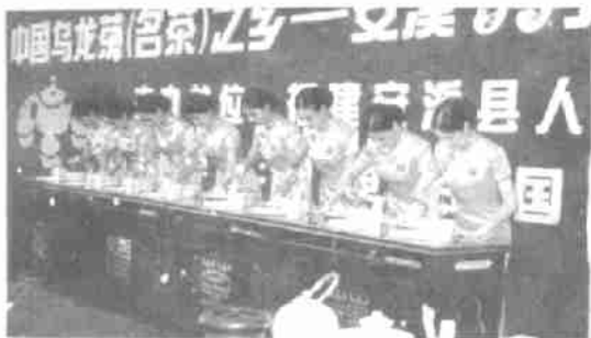
安溪县茶艺队表演的安溪茶艺