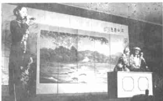
武夷山红袍茗品有限公司茶艺队表演的客家擂茶