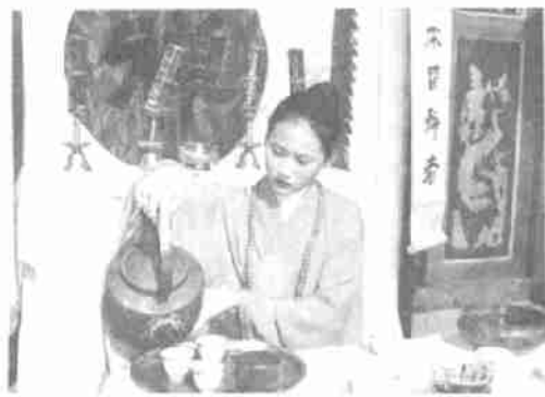
南昌女子职业学校茶艺队表演的禅茶