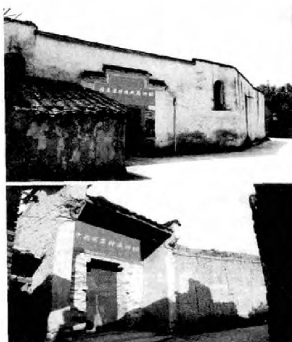
柏柱洋苏维埃革命旧址。

次日晨，游客们进入柏柱洋红色景区。柏柱洋是党在我国南方的最后一块革命根据地，被誉为“闽东的延安”。走进“闽东的延安”，在柏柱洋依山而建的闽东苏区纪念馆，听解说员的深情介绍，把游客带回那烽火连天的革命岁月…… ◀