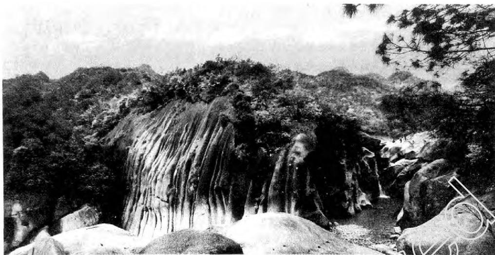
世界地质公园白云山千年石瀑。