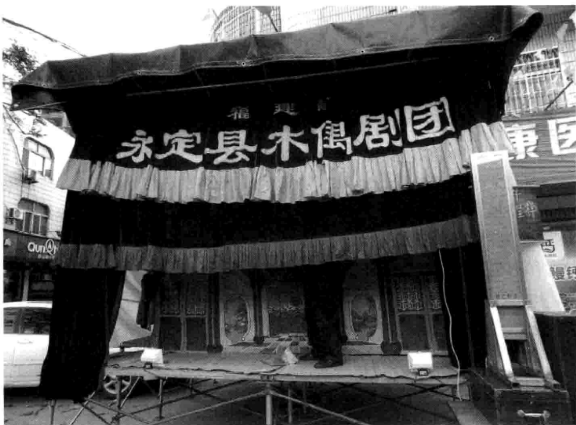
龙岩坎市晚上看戏的庙会场面