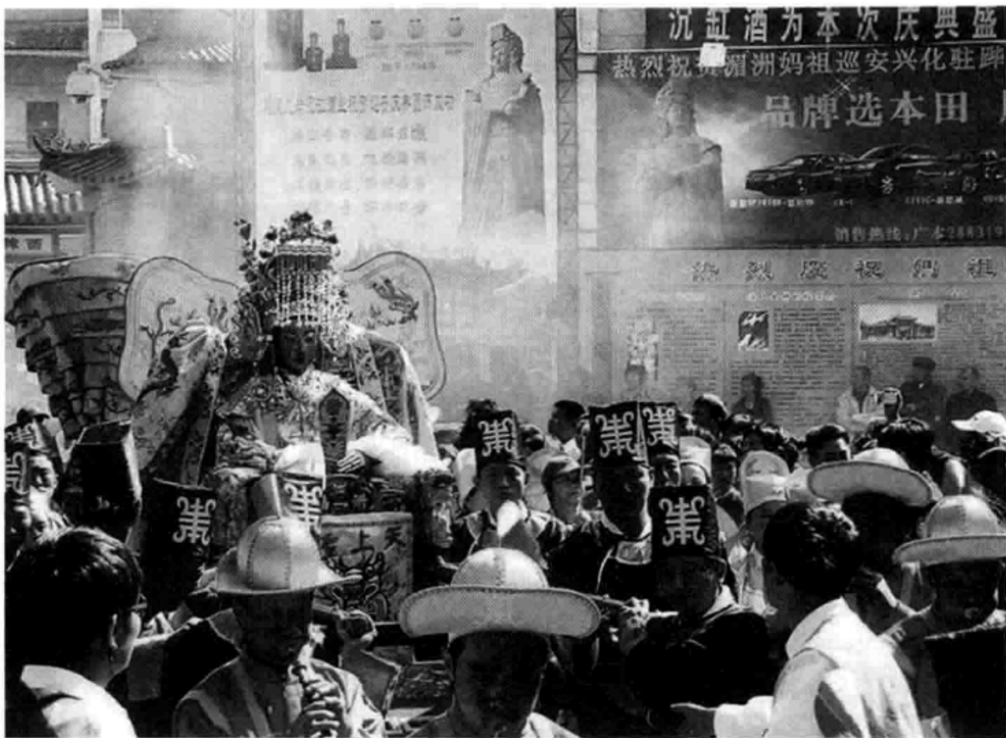
湄洲妈祖金身巡游

湄洲祖庙妈祖巡游习俗与建庙几乎同时产生。按照莆田祀神习俗,庙祭是局部或个别的拜祈神明形式,而绕境巡游则是“福荫全部”,无论贵贱,不分老幼,凡神灵巡游过处,皆布福赐安。所以,对这种巡游习俗民众趋之若鹜,备受欢迎。