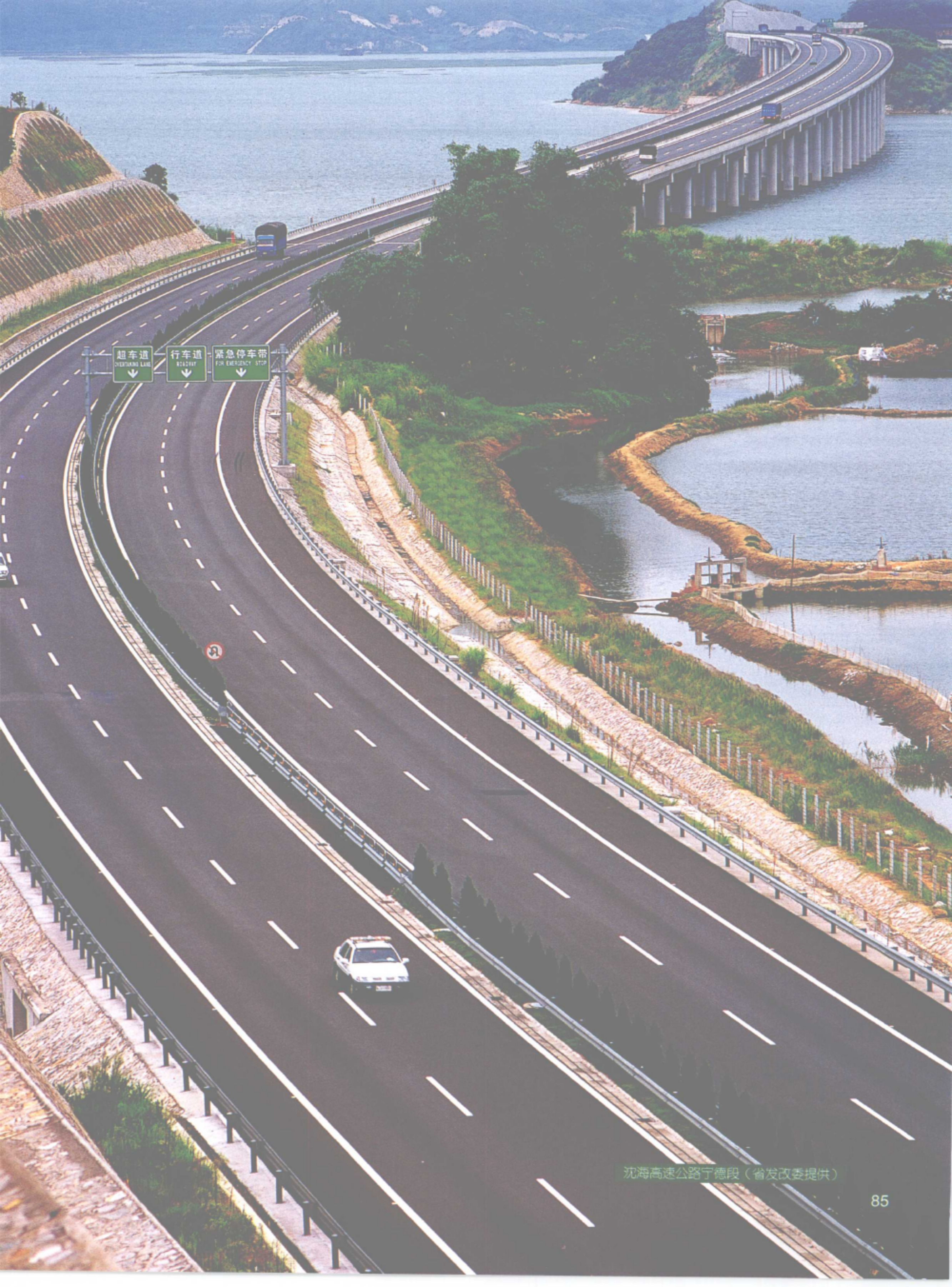
沉海高速公路宁德段