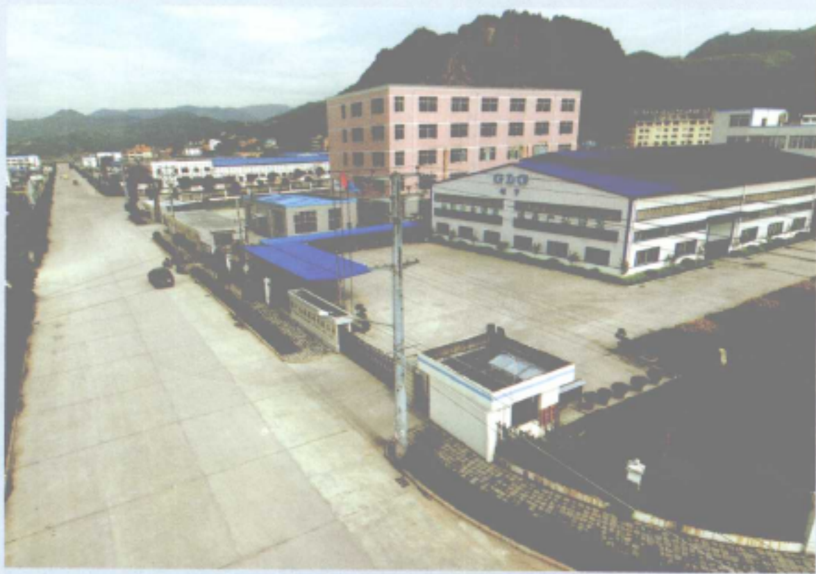
福鼎星火工业园区

是年 地委、行署决定兴建福安、宁德、福鼎3个200公顷民营工业园区。7月，福鼎成立福鼎市星火民营工业园区开发有限公司。8月，福安市秦溪洋工业园区破土动工。